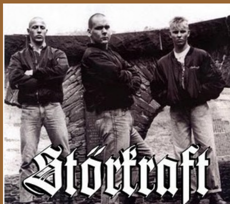
(am "Bollwerk" in Andernach !)